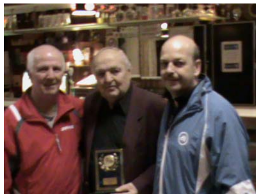
Les vainqueurs du Challenge Froidmont