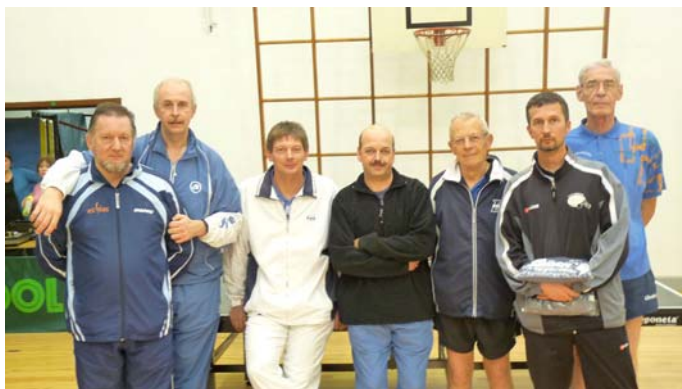
Les lauréats du challenge Gilbert Corbier