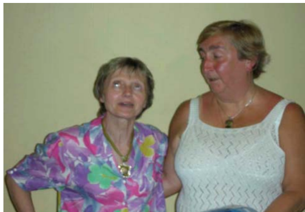
Ch. Prov. et de Belgique Aînées : Oupeye