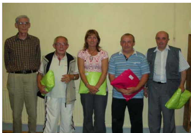
Les premiers du challenge par catégorie