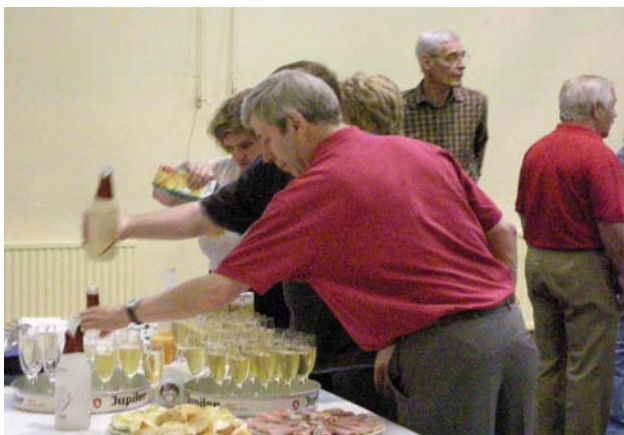
La préparation de l'apéritif et du souper