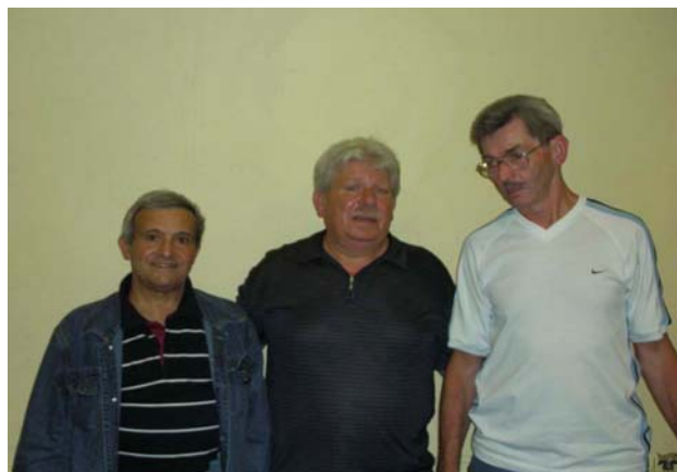
Interclubs commission div. 5 : Ivoz 3