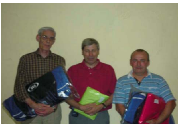
Les trois premiers du challenge