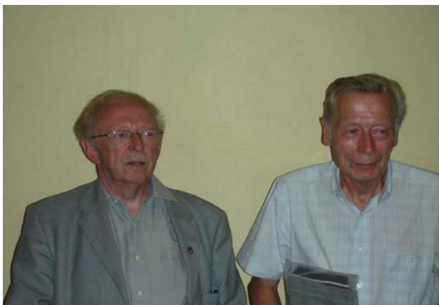
Interclubs commission div. 4 : Gervina