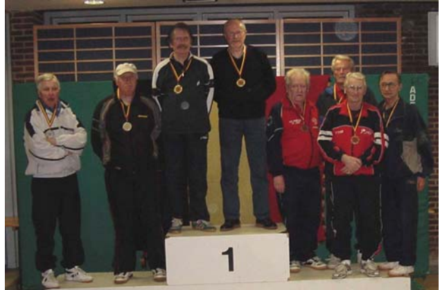
Les deux médailles d'Or liégeoises